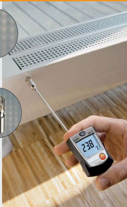
检测冷冻机组的温度