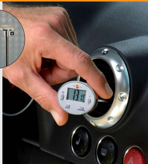
测量空调机组的温度