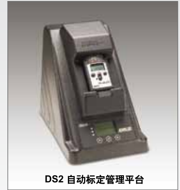
DS2 自动标定管理平台